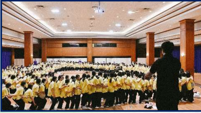
กิจกรรมก้าวต่อไป (ม.3)