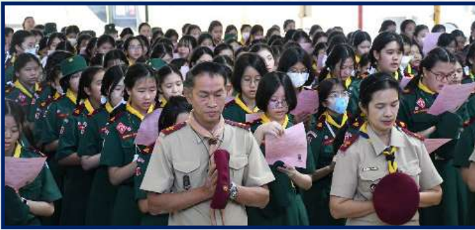
วันศุกร์ที่ 17 - วันเสาร์ที่ 18 พฤศจิกายน 2566 ค่ายลูกเสือ-เนตรนารีสามัญญ์รุ่นใหญ่ ชั้นมัธยมศึกษา ปีที่ 1 และเกรด 7 ณ ค่ายเสือป่าแคมป์ จังหวัดสระบุรี