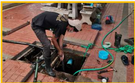
ตรวจอุปกรณ์ระบบบำบัดน้ำเสีย