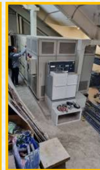
ตรวจอุปกรณ์ไฟฟ้า