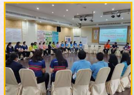
คณะกรรมการเชิงปฏิบัติการ ผู้นำเชิงระบบเพื่อขับเคลื่อนโรงเรียน ENERGY MIND AWARD SEASON 2 จัดโดยกาไฟฟ้านครหลวง