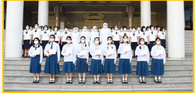
นักเรียนรับเกียรติบัตรจากการประกวดการประหยัดไฟฟ้า