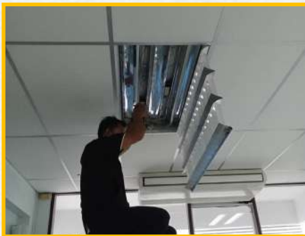
เปลี่ยนหลอดไฟLED