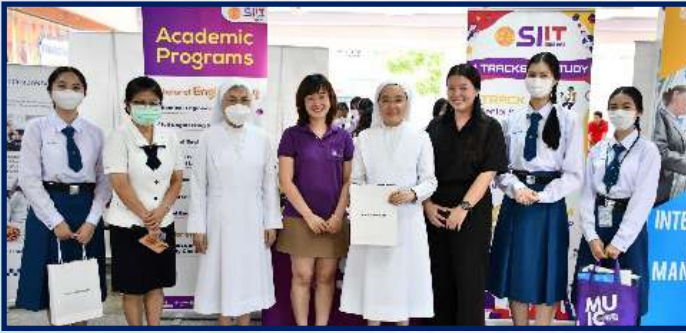
วันพฤหัสบดีที่ 16 พฤศจิกายน 2566 จัดนิทรรศการแนะแนวการศึกษาและอาชีพ ม.4-ม.6 และเกรด 10-เกรด 12 ณ ได้อาคารเซนต์โยเซฟ