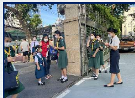
กิจกรรมเนตรนารีรับน้อง