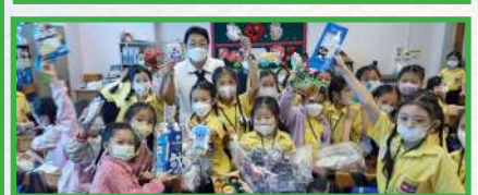
โครงการอนุรักษ์พลังและสภาพแวดล้อม