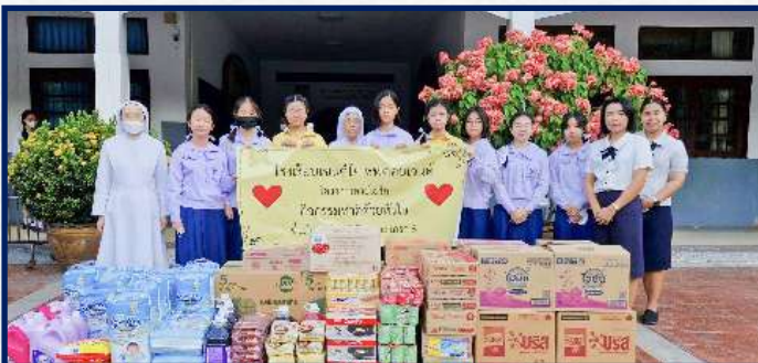
วันพฤหัสบดีที่ 23 พฤศจิกายน 2566 กิจกรรมทำดีด้วยหัวใจสำหรับนักเรียนระดับชั้น มัธยมศึกษาปีที่ 2 และเกรด 8 ณ มูลนิธิธรรมิกชน เพื่อคนตาบอดในประเทศไทย รามอินทรา กรุงเทพมหานคร