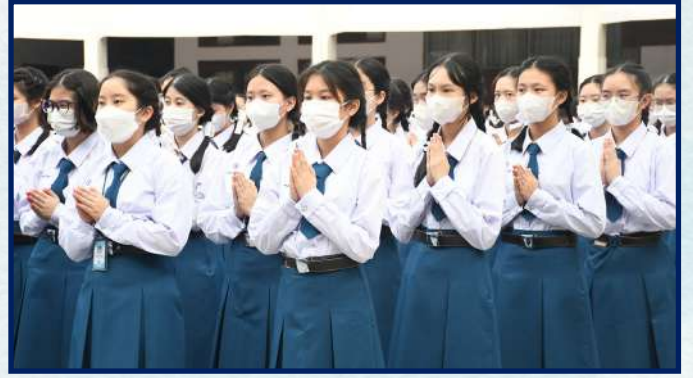
กิจกรรมวันครูแห่งชาติ