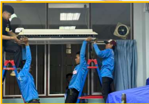
ติดตั้งเครื่องปรับอากาศใหม่ในห้องเรียน