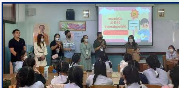
กิจกรรมแบ่งปันความรู้สู่ลูกรัก