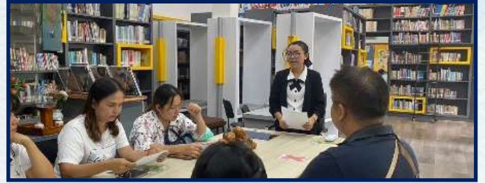
การประชุมผู้ปกครองเครือข่ายสัมพันธ์