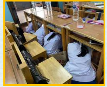
กิจกรรมชักซ้อมหนีไฟและฝึกซ้อมเมื่อเกิดเหตุแผ่นดินไหว