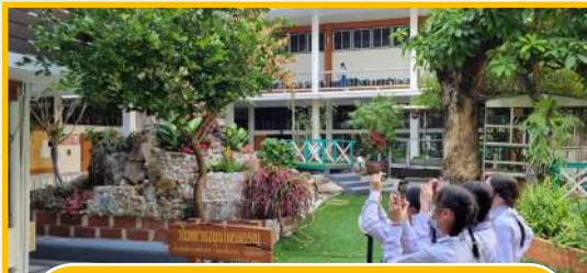
แหล่งเรียนรู้นอกห้องเรียน