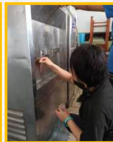
การทำความสะอาดตู้น้ำดื่ม