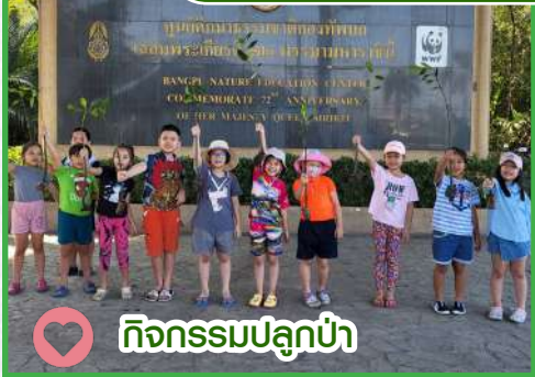
กิจกรรมปลูกป่า