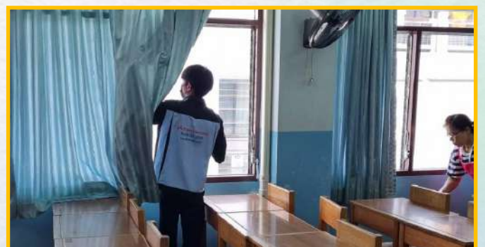
ตรวจปลวกภายนอกและภายในอาคาร