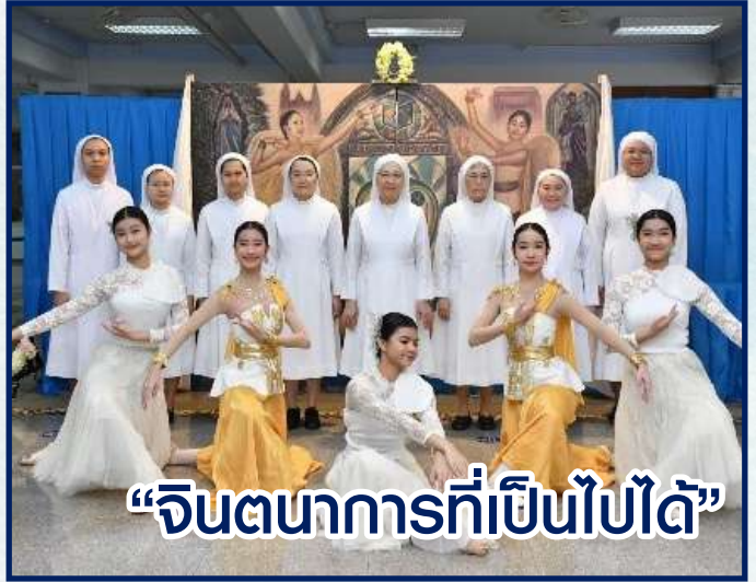
“จินตนาการที่เป็นไปได้”