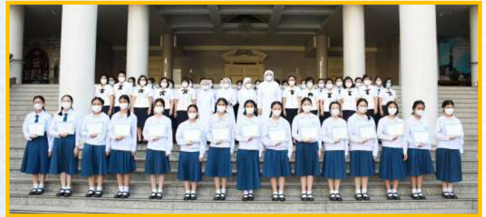
นักเรียนแกนนำนักเรียนรักษ์เพื่อโลกสวย