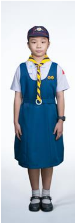
เนตรนารีสำรอง