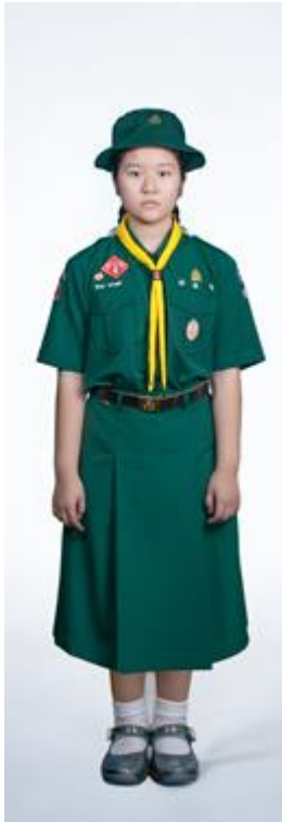
เนตรนารีสามัญ